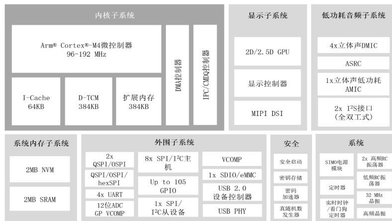
超低功耗Apollo4 Plus SoC的框图

Apollo4 Plus是专门用作电池供电端点设备的应用处理器和协处理器, 其应用领域包括智能手表、儿童手表、健身手环、动物追踪器、远场语音遥控器、健康预测和维护设备以及智能家居设备。